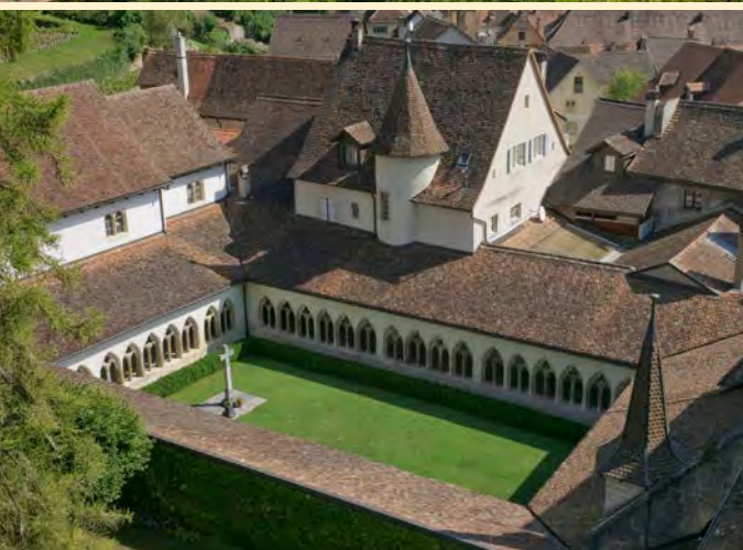
Cloître de la collegiale