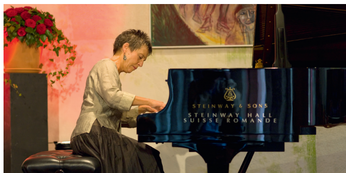
Maria João Pires lors de Piano à Saint-Ursanne 2010